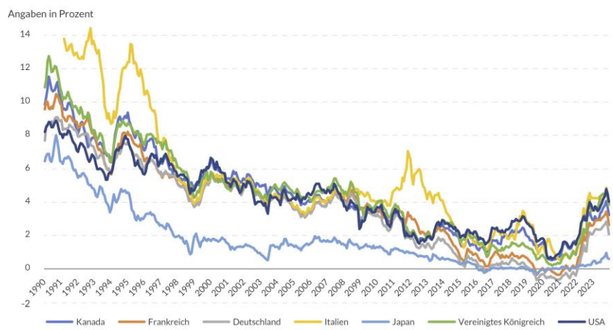
ABBILDUNG 3 Entwicklung der Zinsen zehnjähriger Staatsanleihen zwischen Januar 1991 und Dezember 2023 in den G7-Staaten

Angaben für Italien erst ab März 1991.