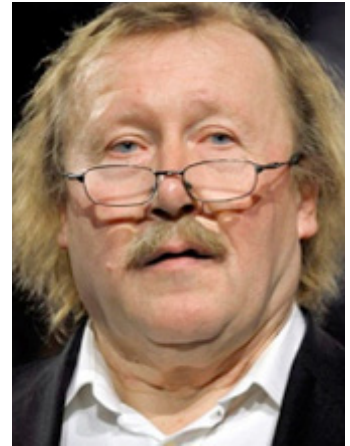
Prof. Dr. Peter Sloterdijk ist Schriftsteller und Philosoph. An der Staatlichen Hochschule für Gestaltung in Karlsruhe ist er Rektor und Professor für Philosophie und Ästhetik.