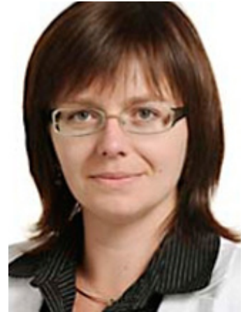
Sidonia Jędrzejewska ist polnische Abgeordnete im Europäischen Parlament. Sie gehört der Fraktion der Euro- päischen Volkspartei an.