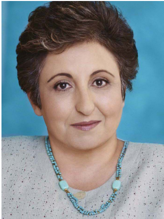
Dr. Shirin Ebadi erhielt 2003 den Friedensnobelpreis. Sie ist iranische Juristin und Menschenrechtsaktivistin.