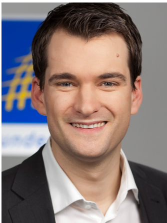
Johannes Vogel ist Mitglied des Deutschen Bundestages. Er gehört der FDP-Fraktion an.