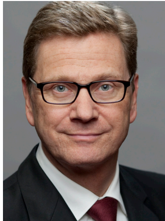
Dr. Guido Westerwelle ist Mitglied des Deutschen Bundestages und Bundesmi- nister des Auswärtigen.