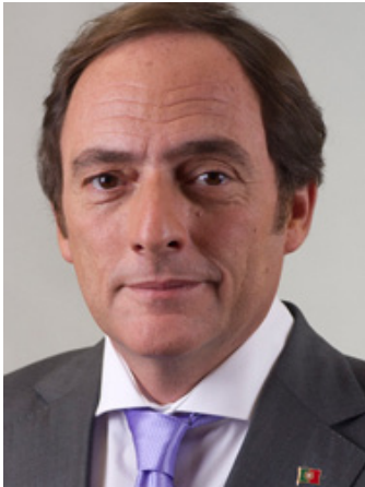
Dr. Paulo Portas ist Minister für Auswärtige Angelegenheiten der Portugiesi- schen Republik.