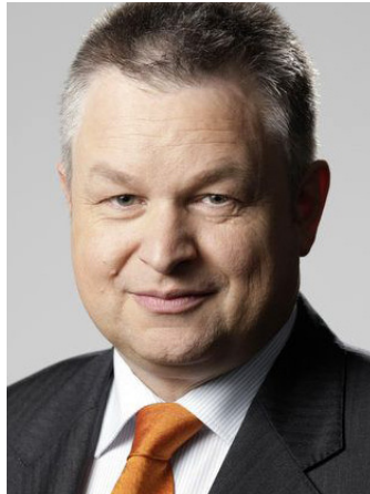
Michael Georg Link ist Mitglied des Deutschen Bundestages und Staatsminister im Auswärtigen Amt.