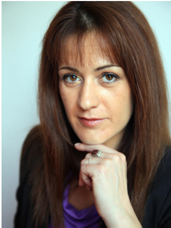
Sandrine Bélier ist französische Abgeordnete im Europäischen Parlament. Sie gehört der Fraktion der Grünen/ Europäische Freie Allianz an.