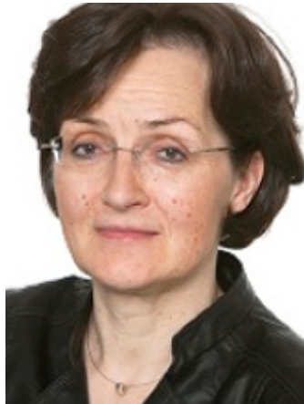
Moderatorin Birgit Wentzien ist Chefredakteurin des Deutschlandfunks.