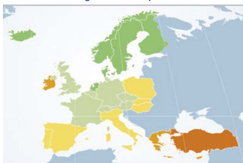
Verteilung Soziale Gerechtigkeit: