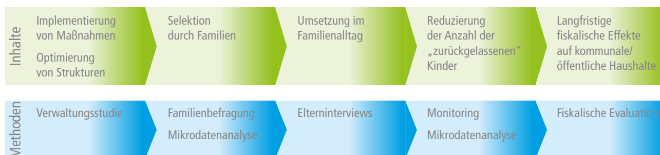
Abbildung 1: Forschungsinhalte und -methoden