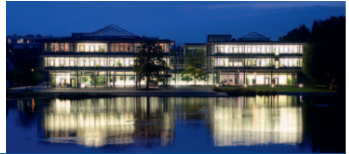
La gran obra del fundador Reinhard Mohn: la Bertelsmann Stiftung, fundada por él en Gütersloh en 1977.

Desde hace más de 30 años, la Bertelsmann Stiftung trabaja para cumplir con la tarea encomendada por su fundador de diseñar el cambio social en beneficio de las personas. La labor de la Fundación se basa en la convicción de que la competencia y el compromiso cívico constituyen un fundamento esencial del progreso social.