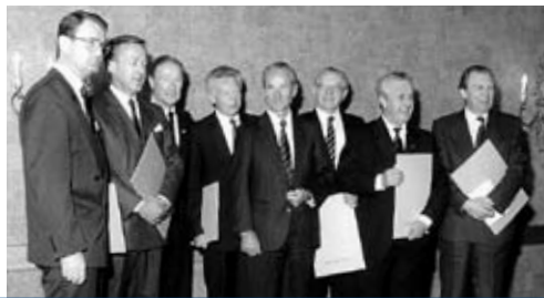
Reinhard Mohn entregó en 1988 por primera vez el premio Carl Bertelsmann. Resultaron galardonados los interlocutores sociales de los sectores económicos de la construcción, la química y el metal por el desarrollo de la negociación colectiva.

Él mismo donó a la Fundación la gran mayoría de sus participaciones en Bertelsmann AG y, de este modo, garantizó que la Fundación, también en el futuro, pudiera actuar sobre una base segura en beneficio de la sociedad. No cabe una muestra mejor, más convincente y más generosa del compromiso y la responsabilidad para con la sociedad.