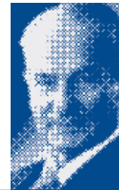
Reinhard Mohn Prize 2011