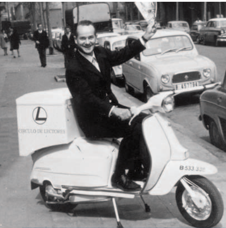
La creación del club español del libro «Círculo de Lectores» significó la entrada de la empresa en el mercado extranjero.

De este modo, sentó los cimientos de una de las mayores empresas de medios del mundo. A Bertelsmann AG pertenecen hoy en día, entre otros, el grupo de entretenimiento RTL, Random House –la mayor editorial del mundo–, la editorial de periódicos y revistas Gruner+Jahr, el proveedor de servicios arvato y DirectGroup.