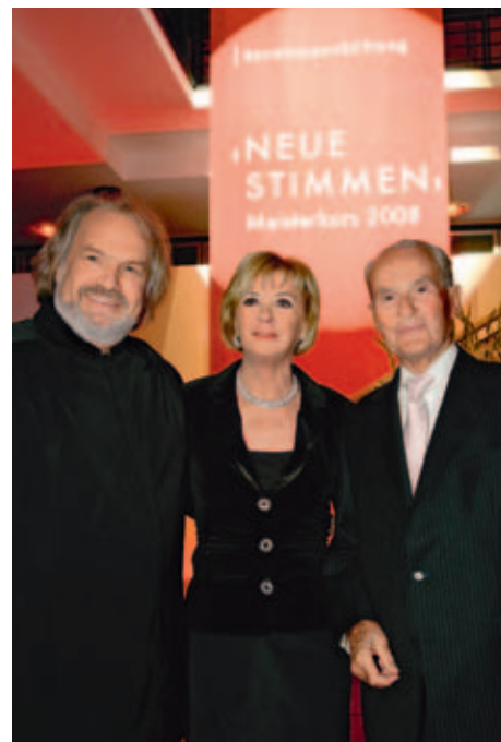
Concurso internacional de canto NEUE STIMMEN: en el curso magistral 2008 con el director artístico del concurso, el maestro Gustav Kuhn.