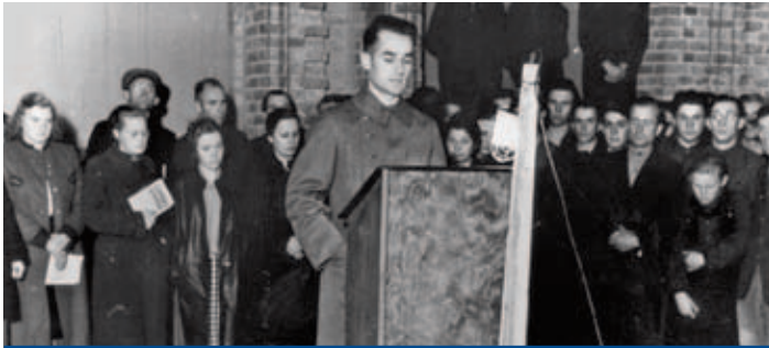
Vistiendo todavía su abrigo de soldado, Reinhard Mohn habla en 1947 tras su regreso del cautiverio estadounidense ante los trabajadores de la empresa destruida.

Gracias a la creatividad de los trabajadores y al compromiso de los directivos, Reinhard Mohn desarrolló ideas innovadoras, como el círculo de libros y discos, construyendo, de este modo, los cimientos de un crecimiento rápido y sostenible. No tardó en promover la internacionalización: las actividades de la Bertelsmann AG llegaron a España y Francia y de allí hasta Sudamérica y, más tarde, a los Estados Unidos.