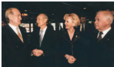
Johannes Rau, Reinhard Mohn, Liz Mohn y Kurt Biedenkopf durante la celebración del 25º aniversario de la Bertelsmann Stiftung en Gütersloh.