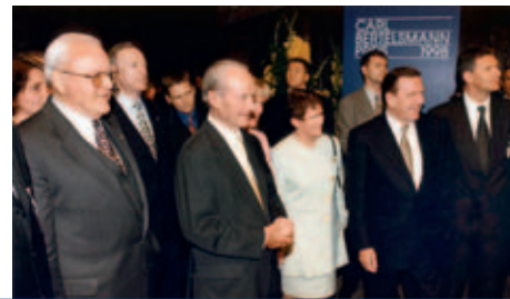
Premio Carl Bertelsmann 1998: el Presidente Federal alemán Roman Herzog, Reinhard Mohn, la Presidenta del Bundestag Rita Süßmuth y el Canciller Federal alemán Gerhard Schröder (de izquierda a derecha).