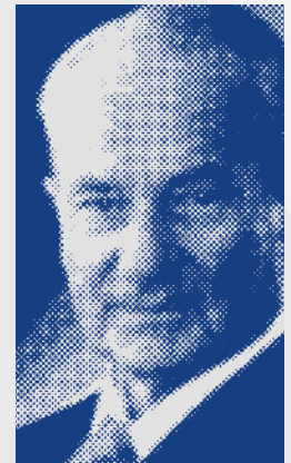
Reinhard Mohn Preis 2013