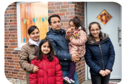
Wohnen und Unterbringung