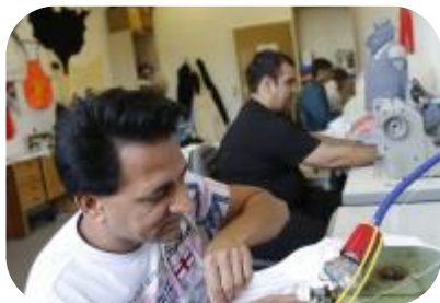
Arbeit & Ausbildung