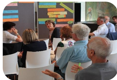
Dialog & Beteiligung