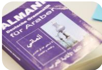
Bildung & Sprache