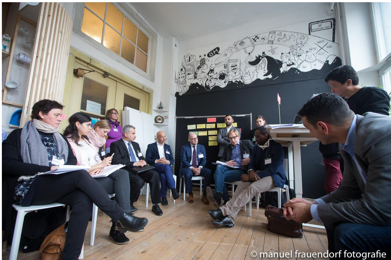
Ein Eindruck aus der Session zum Thema Global Skill Partnerships.

*Wichtigstes Ergebnis der Session (nach dem Voting der Teilnehmenden).