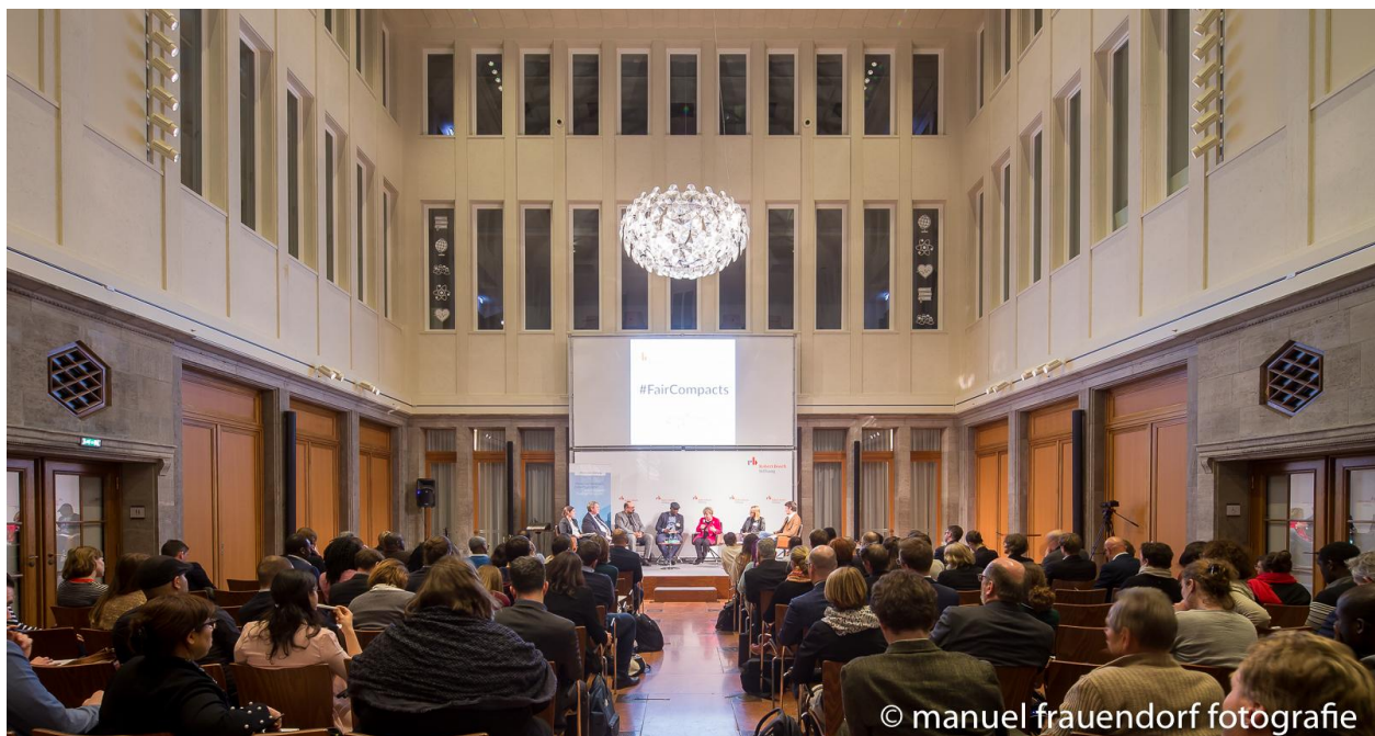
Ein Eindruck aus der Dialogveranstaltung mit den Bundesressorts.

Beim Abendplenum waren Vertretungen der relevanten Bundesministerien anwesend – BMAS, BMI, BMFSFJ, AA und BMZ. Im Zuge des Fishbowl-Formats konnte dann jeweils ein Teilnehmer oder eine Teilnehmerin des BarCamps aufs Podium steigen und die zentralen Impulse des BarCamps in die Diskussion einbringen.