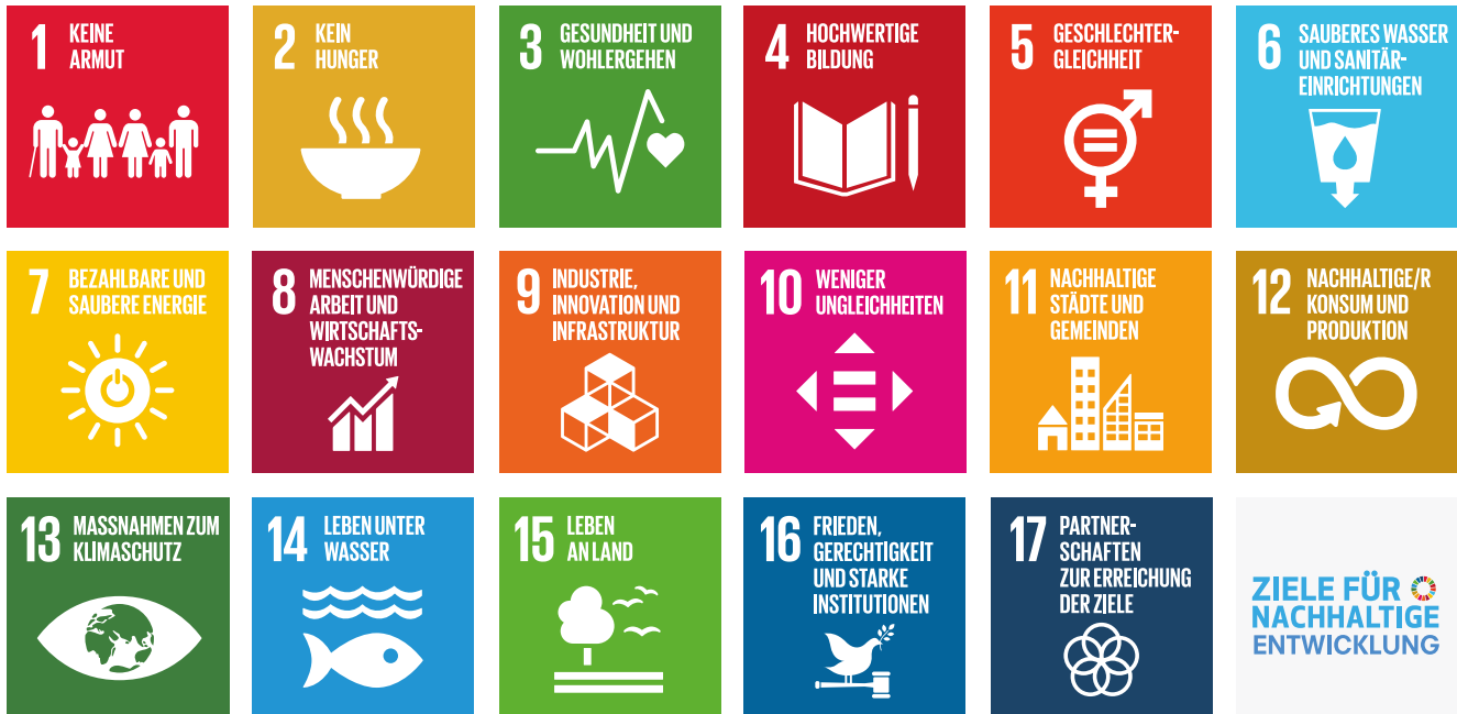
ABBILDUNG 3 Die 17 Ziele für nachhaltige Entwicklung