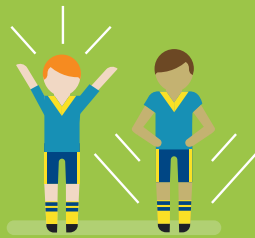
machen Fortschritte in ihrer Persönlichkeitsentwicklung