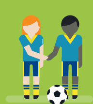
zeigen respektvolleres Verhalten im Team