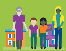
tragen zum friedlichen Zusammenleben in der Gesellschaft bei