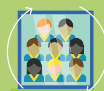
reflektieren gemeinsam(e) Werte und Haltungen