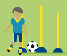
orientieren sich an diesen Werten im Miteinander