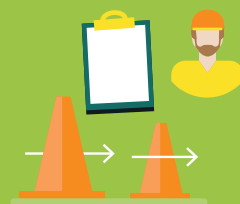
erlernen geeignete Methoden