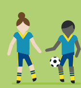
erarbeiten mit ihren Trainern Mannschaftswerte