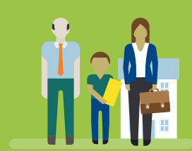
bringen Erlerntes in ihren Alltag in Schule, Familie und Freizeit ein