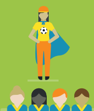
nehmen ihre Rolle als Vorbild bewusst ein