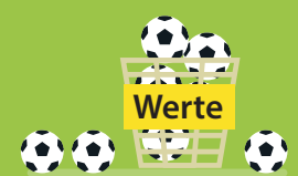
integrieren Wertebildung in den Fußballalltag